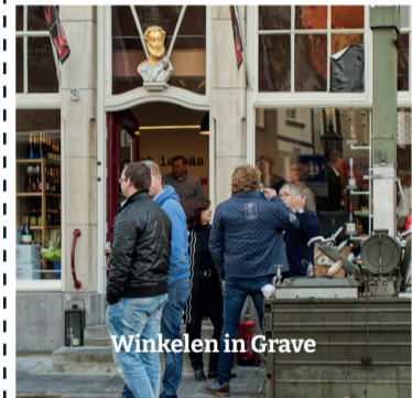
Winkelen in Grave