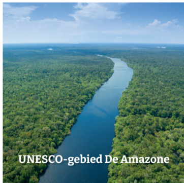
UNESCO-gebied De Amazone