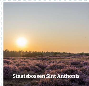
Staatsbossen Sint Anthonis