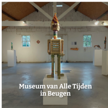
Museum van Alle Tijden in Beugen