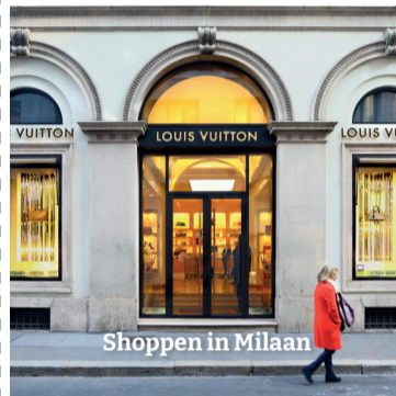
Shoppen in Milaan