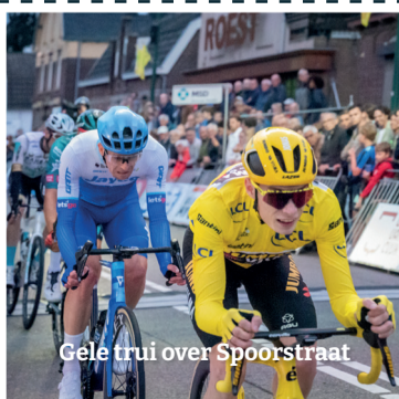
Gele trui over Spoorstraat