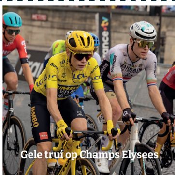
Gele trui op Champs Elysees