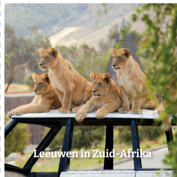
Leeuwen in Zuid- Afrika