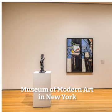
Museum of Modern Art in New York