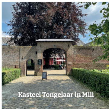
Kasteel Tongelaar in Mill