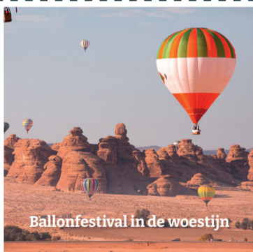
Ballonfestival in de woestijn