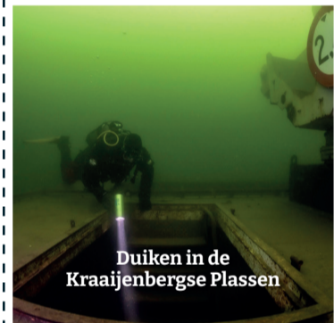
Duiken in de Kraaijenbergse Plassen