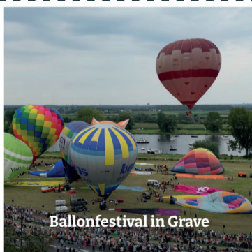
Ballonfestival in Grave