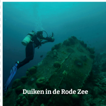
Duiken in de Rode Zee