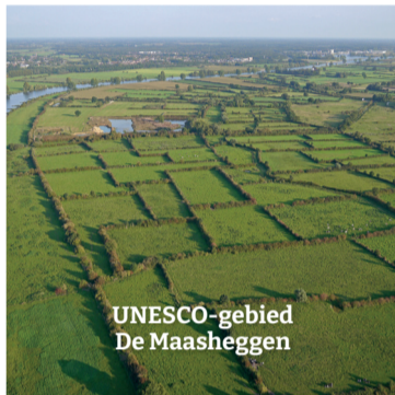
UNESCO-gebied De Maasheggen