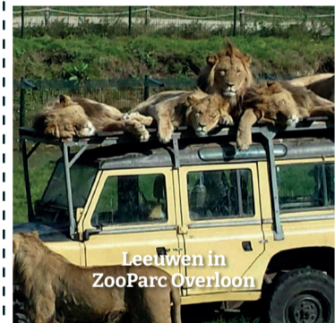
Leeuwen in ZooParc Overloon