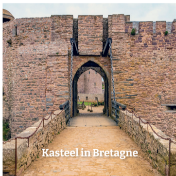
Kasteel in Bretagne