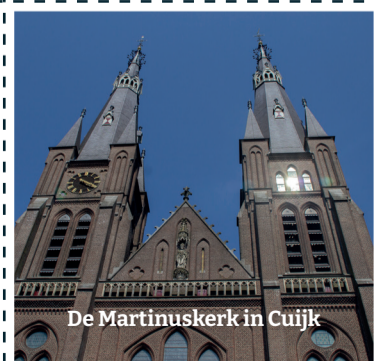
De Martinuskerk in Cuijk